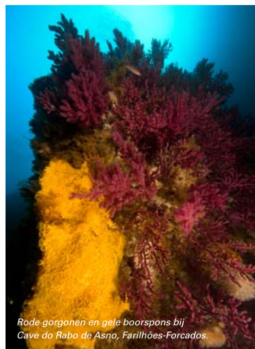
Rode gorgonen en gele boorspons bij Cave do Rabo de Asno, Farilhões-Forcados.