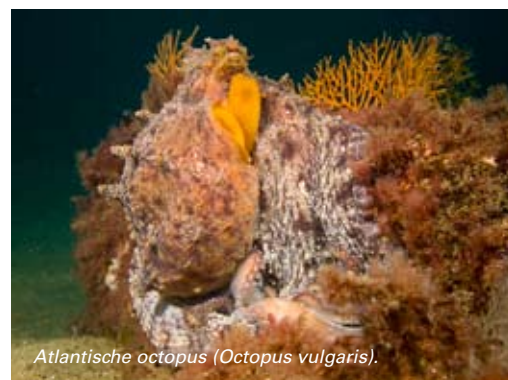
Atlantische octopus ( Octopus vulgaris ).

Duikcentrum Cipreia, Porto de Abrigo de Sesimbra, Pavilhão 3, 2970 Sesimbra, Portugal. Web: www.cipreia.pt Duikcentrum Haliotis, Hotel Praia Norte, Av. Monsenhor Bastos 206, 2520 Peniche, Portugal. Web: www.haliotis.pt