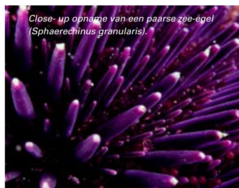
Close-up opname van een paarse zee-egel ( Sphaerechinus granularis ).

vrijwel ieder weekend kan worden gedoken op de riffen rond Sesimbra. Gelukkig wordt er tijdens de vakantieperiode ook doordeweeks uitgevaren, zodat wij in gelegenheid zijn om enkele duiken bij Sesimbra te maken. Bij duikcentrum Cipeira is het tempo van voorbereiden behoorlijk relaxed; een uur te laat vertrekken is geen uitzondering.