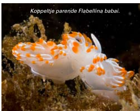
Koppeltje parende Flabellina babai .