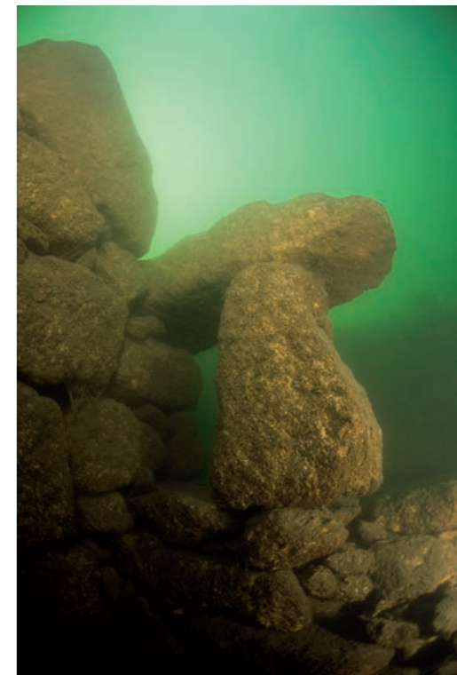
Boven: Delen van Vilarinho, zoals dit stenen kozijn, steken 's zomers boven de waterspiegel uit.