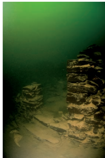
Van links naar rechts: Voormalige waterplaats van Castanheiras - Castelo do Bode. Restanten van een huis dat na meer dan een halve eeuw onder water nog altijd overeind staat. Dode boom op een kale zandbodem, zoals je ze normaal gesproken in een gortdroge woestijn verwacht. Trap van de toegang tot een voormalig gebouw.

van het meer tref je deze weg ook weer aan. Ergens onder water zou de oude brug 'Ponte Vale de Ursa' zich bevinden. Om bij deze brug te komen moet er helaas, op het heetst van de dag, een ruime 500 meter boven de oude weg gesnorkeld worden. Eenmaal aangekomen bij de juiste plek, dalen we geleidelijk door het groene water af. Na enkele meters wordt duidelijk dat het dragen van een droogpak toch geen overbodige luxe is. Het kwik is namelijk snel gedaald van 26 naar 12 graden. De weg naar beneden wordt verder gevolgd,