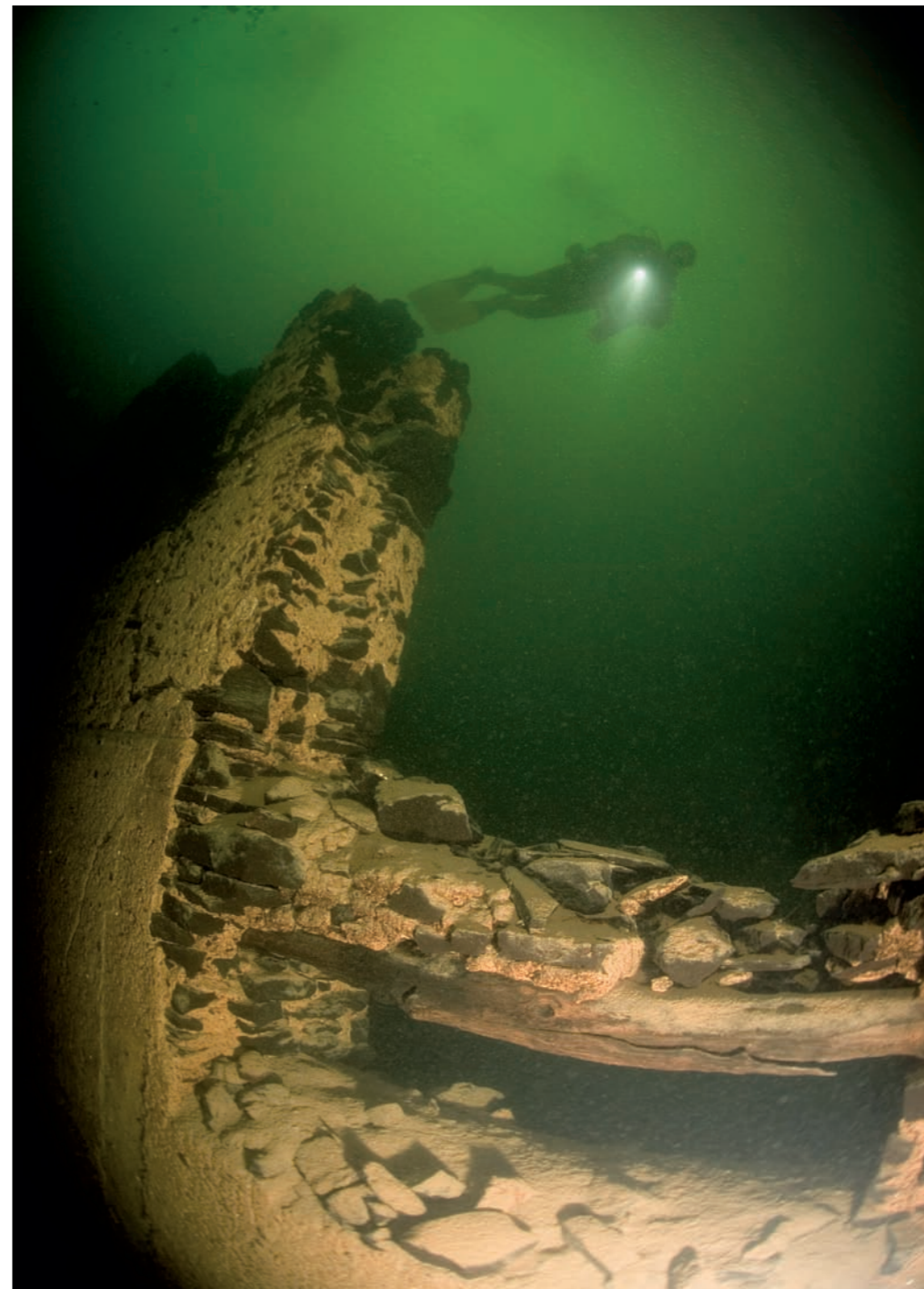
Een van de weinige restanten van Castanheiras waarin nog hout te vinden is. Bijna alles dat op welke manier dan ook nog nuttig kon zijn, werd meegenomen door de toenmalige bewoners.

diepte staat een huis dat nog goed herkenbaar is, omdat de vallei pas in 1971 is ondergelopen. De overblijfselen zijn nauwelijks begroeid en er is weinig leven. Enkel een klein visje laat zich zien. Op het eerste gezicht lijkt Vilarinho niet meer dan wat muren en straten, maar gaandeweg ervaren we een gevoel dat je als voyeuristisch zou kunnen omschrijven: zwevend tussen en door de huizen lijkt het alsof we daadwerkelijk door iemands leefomgeving gaan. Dit wordt versterkt door de algen die het water prachtig groen kleuren, maar ook het zicht beperken tot