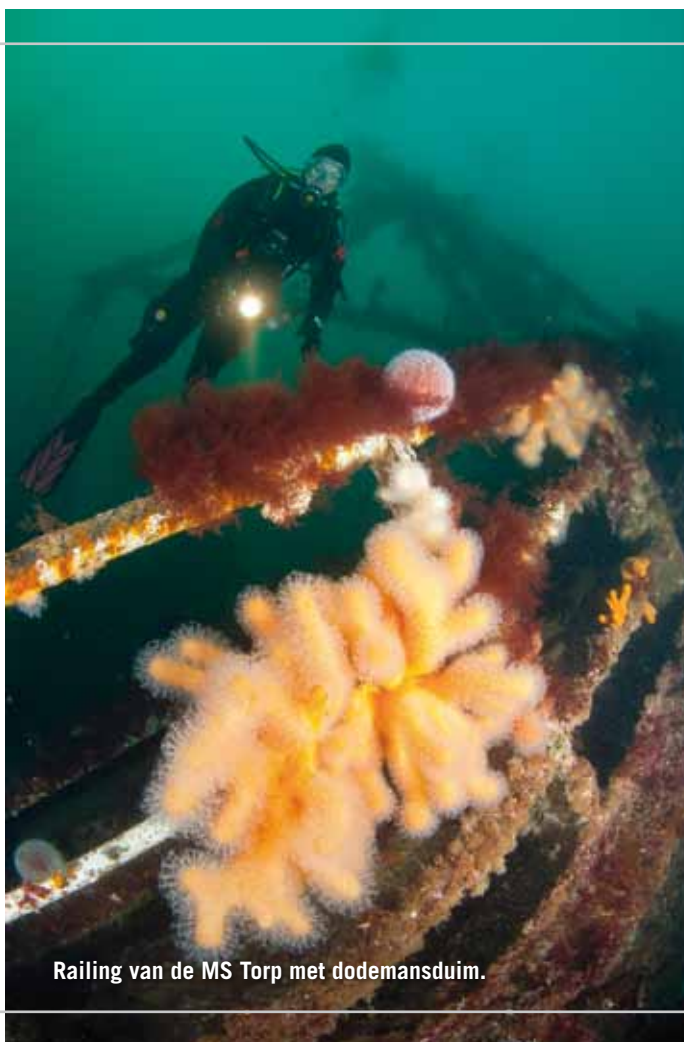
Railing van de MS Torp met dodemansduim.