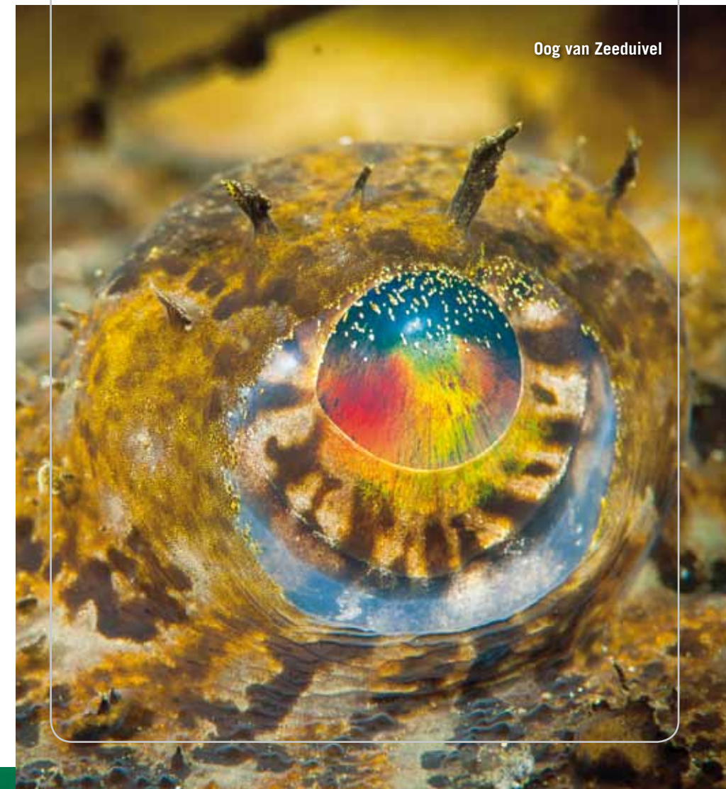
Oog van Zeeduivel

Op Strømsholmen is niet veel meer te doen dan duiken en vissen. Het eerste vinden we fantastisch, maar aan het tweede hebben we een broertje dood. Gelukkig is er binnenin het fjord een duikstek waar nauwelijks wordt gevist: Alpentoppen. Het is een rif dat vanuit grote diepte tot bijna aan de oppervlakte reikt. Er staat een lichte getijdenstroming en er is dus een voortdurende aanvoer van voedsel voor het leven dat daar floreert. Een combinatie die de duikstek boven de rest laat uitsteken. Hier zwemmen nog grote hoeveelheden pollack en andere vissoorten om ons