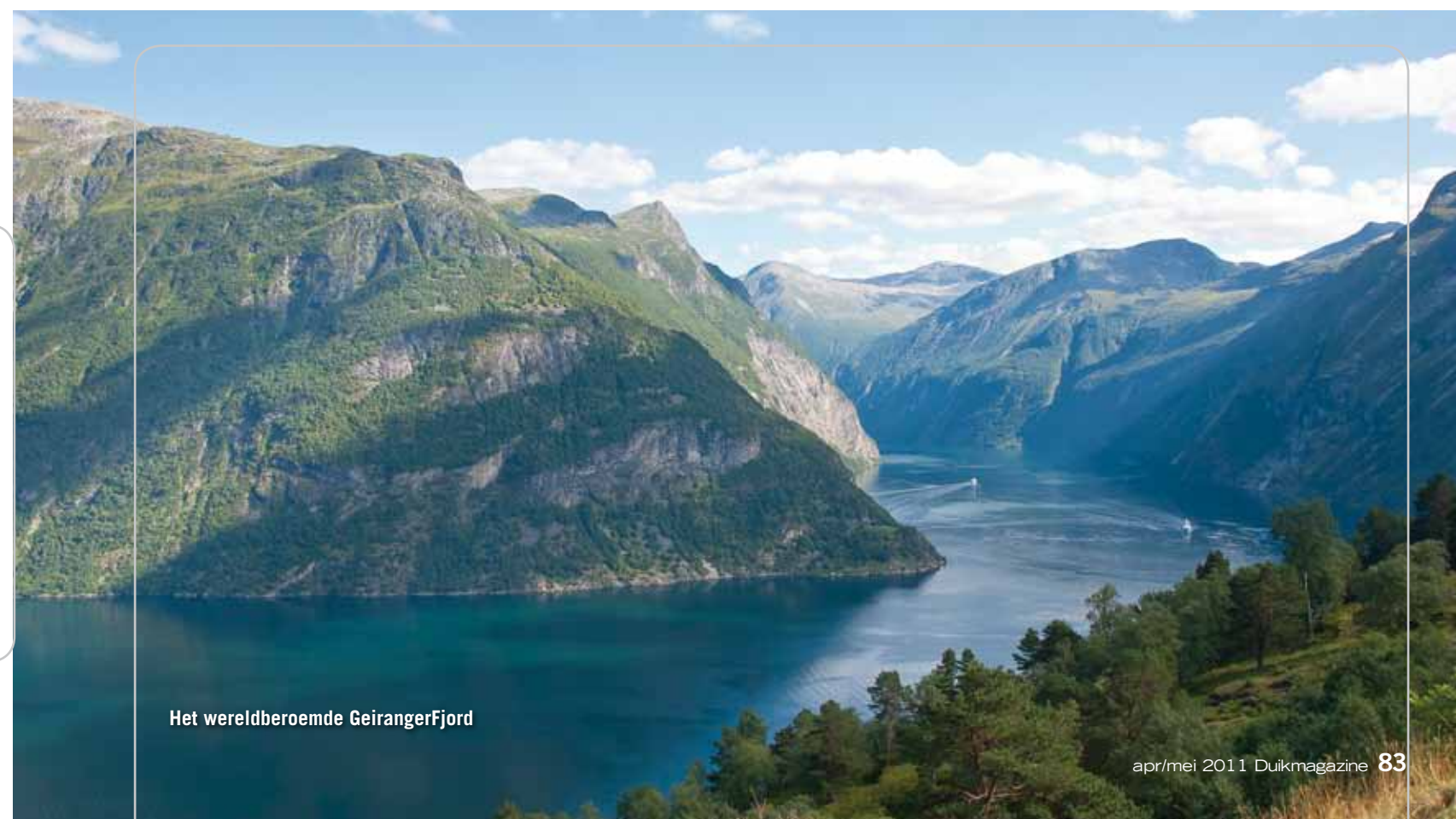
Het wereldberoemde GeirangerFjord