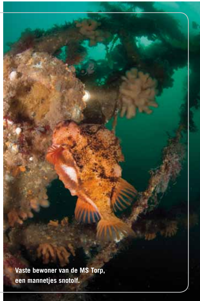
Vaste bewoner van de MS Torp, een mannetjes snotlof.