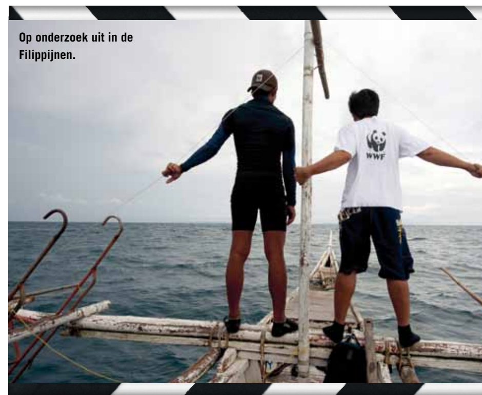
Op onderzoek uit in de Filipijnen.

"Ik deel de mening dat een paar van de certificeringen niet terecht zijn. Het gaat om een paar procent van alle certificeringen en ik vind niet dat we daarom het kind met het badwater moeten weggooiden. Dit is momenteel het enige instrument waarmee we iets