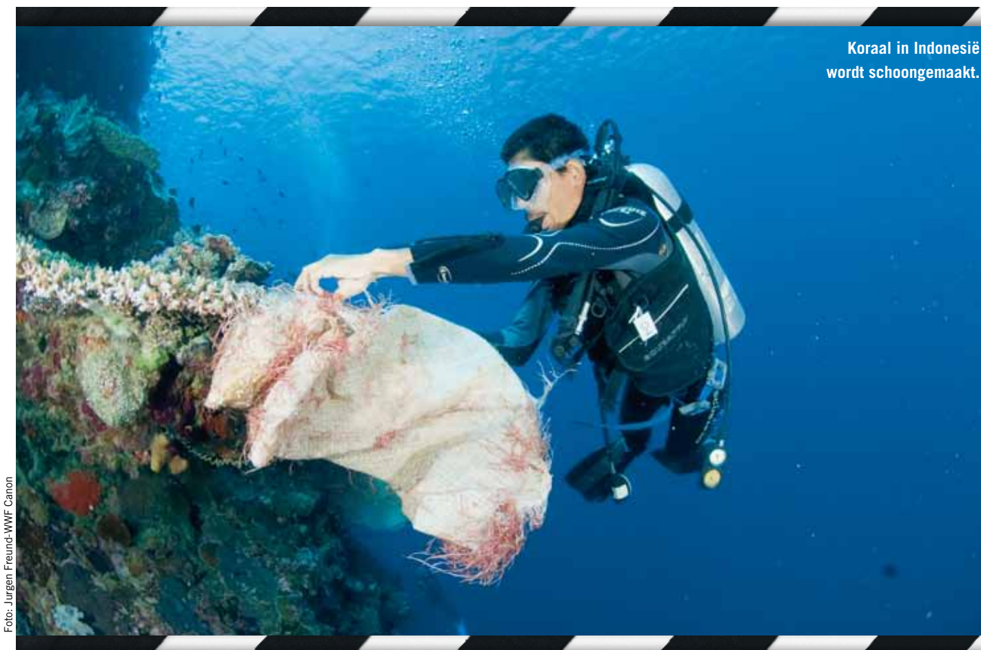
Koraal in Indonesië wordt schoongemaakt.