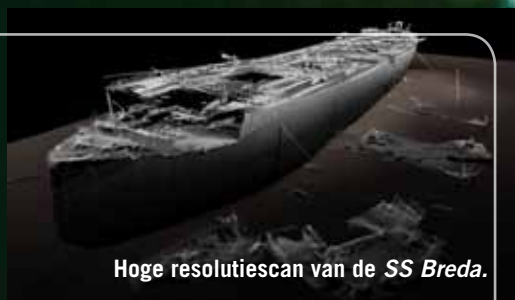
Hoge resolutiescan van de SS Breda.

lonie leeft. De kans is dus altijd aanwezig dat je er opeens een verrassende duikbuddy bijhebt. Maar ook zonder dit extraatje is het niet moeilijk om volop te genieten van een duik op dit wrak. De Thesis blijkt één van de mooiste en rijkst begroeide wrakken die we tot nu toe in koud water hebben gezien. Het voormalig stalen Ierse vrachtship ligt al sinds 1889 tegen dit eiland en het is in de afgelopen honderdtwintig jaar letterlijk vermagerd tot een skelet: maar het blijkt allermist dood! Weinig wrakken zijn nog zo intact, terwijl je er aan alle kanten in- en uit kunt zwemmen. Prachtig gebogen scheepsribben staan fier overeind en vormen een indrukwekkende constructie, door het dek schijnt een groen lichtenspel. Overal zijn mooie doorkijk en -zwemmogelijkheden en de hoeveelheid dodemansduim is zelden geëvenaard: het wrak lijkt van een afstand volledig met geel pluche te zijn bekleed. Een nauwkeuriger blik op het leven leert ons dat er veel verschillende naaktslakken op de diverse mosdiertjes zitten en af en toe springt er nog een krab tussen de anjelieren en dodemansduimen door. Een fantastische duik, die helaas veel te snel aan zijn eind komt. Eenmaal terug aan boord vragen we ons af hoe lang de overblijfselen van dit wrakkenkarkas nog overeind blijven staan, want 120 jaar en een flinke getijdenstroom moet op een zeker moment wel zijn uitwerking gaan hebben. Maar gelukkig hebben wij de Thesis in zijn 'glorietijd' met goed zicht kunnen zien én vastleggen.