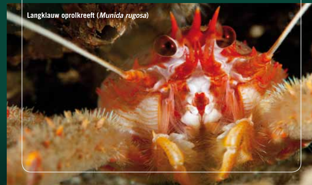
Langkluw oprolkreeft ( Munida rugosa )

De niet geborgen lading biedt prachtige stilleven s die voorzichtig verlicht worden door een stralende zon