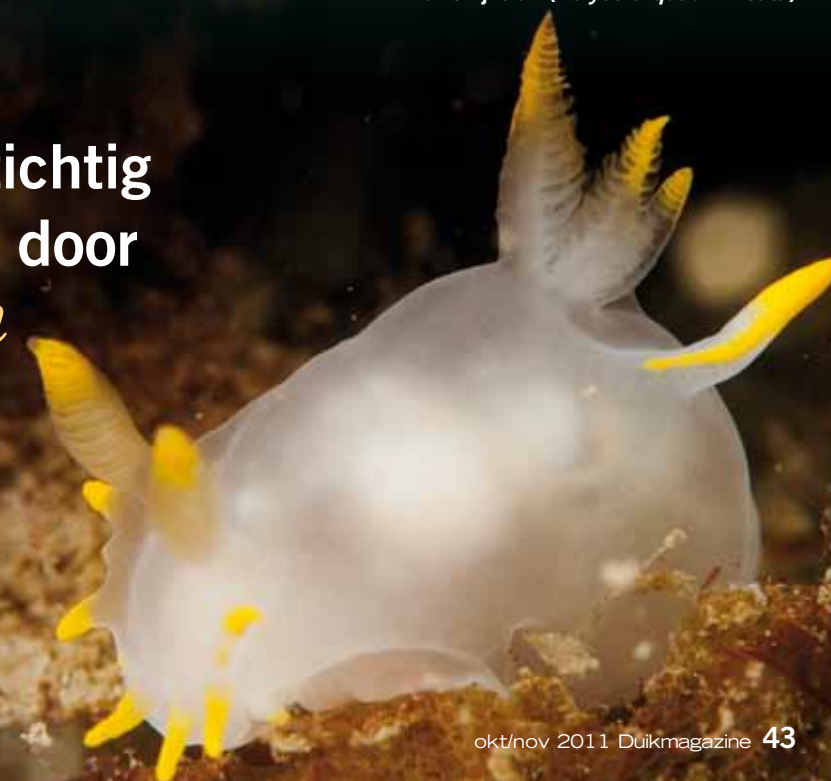
Harlekijnslak ( Polycera quadrilineata )

De niet geborgen lading biedt prachtige stilleven s die voorzichtig verlicht worden door een stralende zon