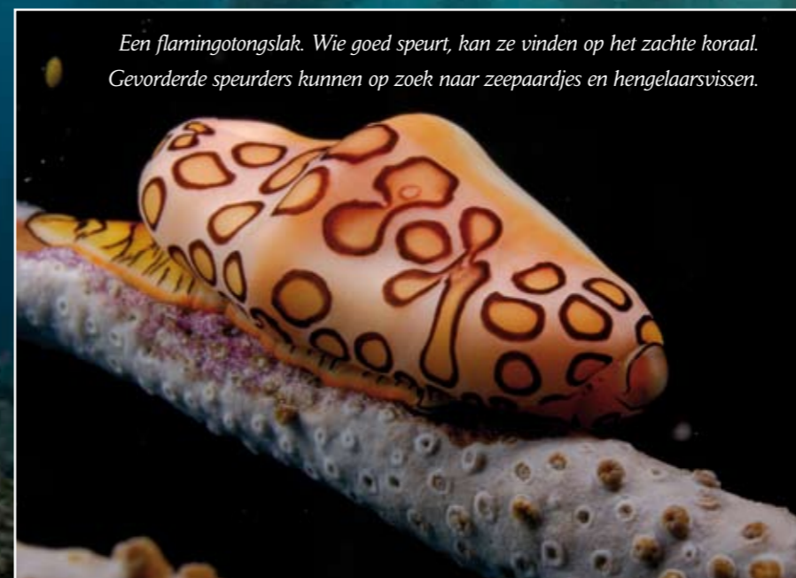
Een flametongslak. Wie goed speurt, kan ze vinden op het zachte koraal. Gevorderde speurders kunnen op zoek naar zeepaardjes en hengelaarsvissen.