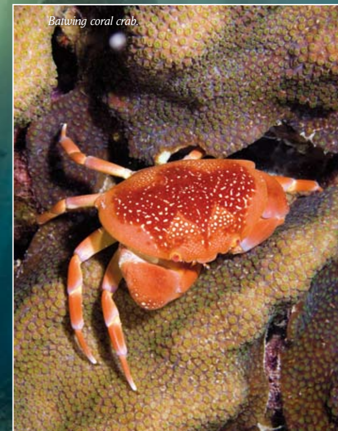
Batwing coral crab.