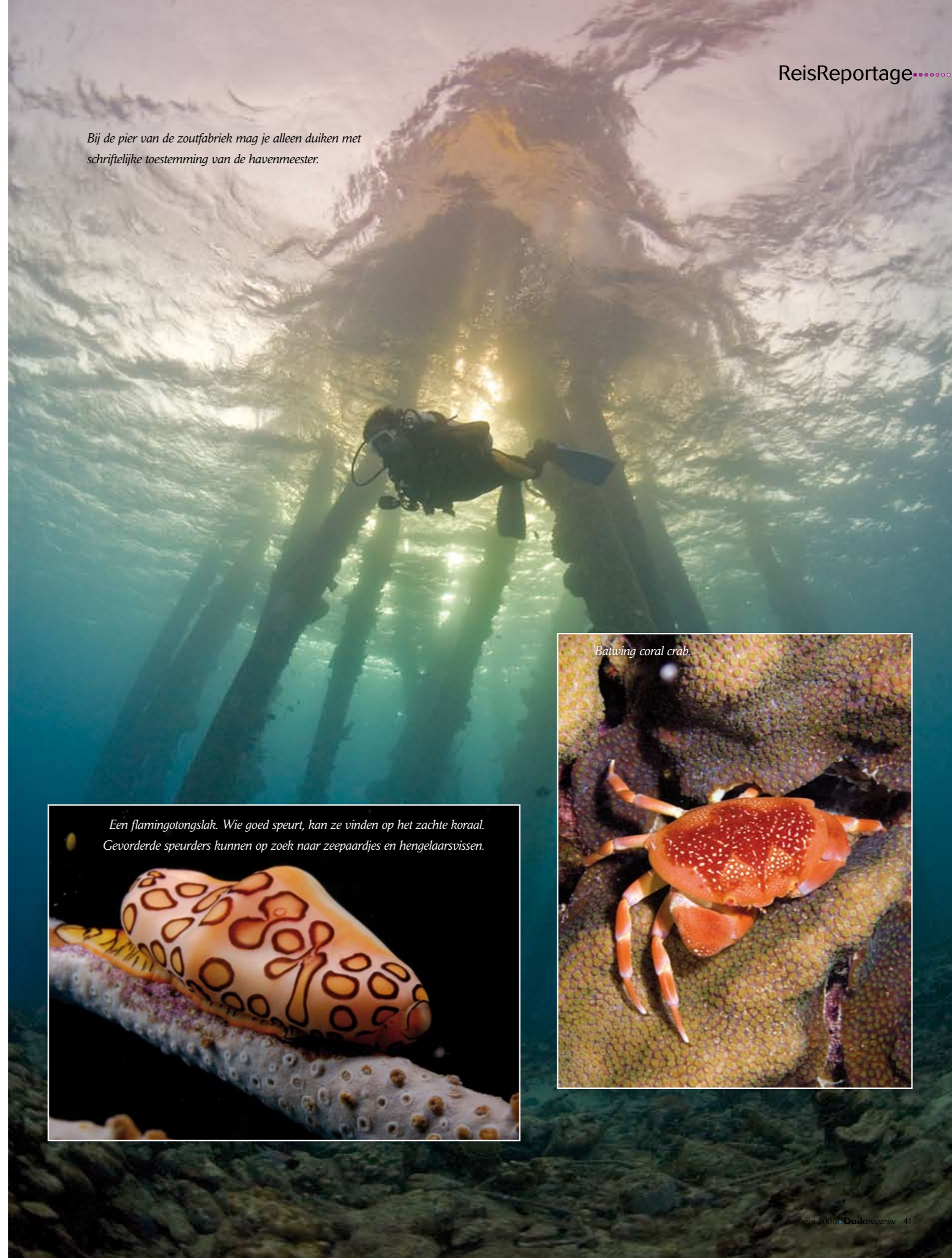
Bij de pier van de zoutfabriek mag je alleen duiken met schriftelijke toestemming van de havenmeester.

'I penetrated a hooker', staat er op de T-shirts die je in Kralendijk, de hoofdstad van Bonaire, kunt kopen. Ze zijn bedoeld voor de fans van het plaatselijke wrak, de Hilma Hooker. Wrakken zijn vaak tegenvallende duikstekken; wie wil er kijken naar een dode boot als er levende riffen naast liggen? Ze trekken bovendien een apart soort duikers aan, dat alles van een boot afsloopt en vervolgens uit elkaar laat vallen omdat ze niet weten hoe je onderwater-vondsten moet conserveren. Ze dragen bijna altijd zwarte duikpakken onder water en rare T-shirts boven water. De Hilma Hooker, daarentegen, kan zelfs verstokte wrakhaters bekoren. Er steken metalen buizen uit, en buizen van spons, en sponzen die om stukken metaal zijn gegroeid en er dus een beetje tussenin zitten. In de tweeëntwintig jaar dat het er ligt, is het langzaam veranderd in een techno-organisch geheel waar het onderscheid tussen leven en schip niet duidelijk meer te zien is. De Hooker is prima te bereiken vanaf de nabijgelegen duikstek Angel City, zodat je onderweg een mooi stuk rif meepakt, en meer ruimte om te parkeren hebt. Behalve tarpons en barracuda's zitten er namelijk ook vaak grote groepen duikers rond het afgezonken schip; de enige drukke duikstek op het eiland. Voor dit ene wrak is dat volkomen terecht.