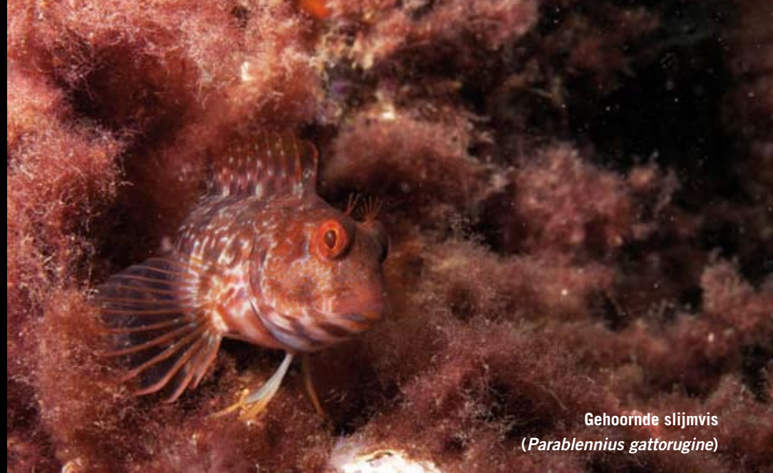
Gehoornde slijmvis ( Parablennius gattorugine )

Tegen de avond bereiken we de traditionele Baskische hoofdstad Gernika, die zich in het meest noordelijke deel van de deelprovincie Biskaje bevindt. Op de weg van Bermeo naar Bakio, staat op circa vijftig meter boven de zeespiegel de vuurtoren van kaap Machichaco. Omdat deze een eind de zee in steekt, vermoeden we dat hier het onderwaterleven wel eens op zijn mooist zou kunnen zijn. Vanuit hier is het echter onmogelijk het water te bereiken, dus we rijden een stuk terug en nemen de eerste afslag richting zee. Beneden aangekomen wanen we ons even in Zeeland. Een duikstel uit Bilbao maakt zich op de parkeerplaats gereed voor een nachtduik. Zij adviseren ons een stukje uit te zwemmen en dan het rif aan onze linkerhand te volgen. Zojuist had een snorkelaar op de hoek een maanvis gezien! Beiden zijn we direct erg enthousiast en nieuwsgierig geworden naar wat de duik ons de volgende dag zou gaan brengen. Op de parkeerplaats bevinden zich nog meer campers en we besluiten de nacht bij de duikstek, genaamd Harribolas, door te brengen.