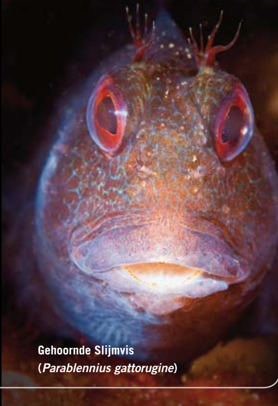
Gehoorde Slijmvis (Parablennius gattorugine)

soorten anemonen, sponzen en kokerwormen. We komen ook een enkele zeenaaktslak tegen. Omdat deze duikplaats niet beschermt ligt, is het ook minder vaak mogelijk om hier vanaf de kant te duiken. Erg rouwig zijn we er niet om, omdat we nog een kantduikstek aanbevelen hebben gekregen; de haven van Elantxobe.