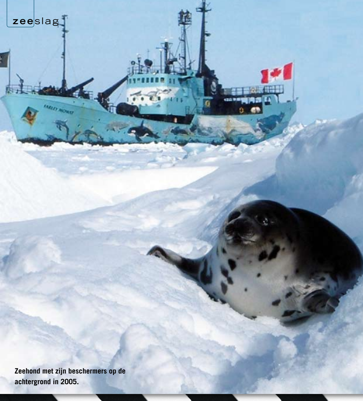
Zeehond met zijn beschermers op de achtergrond in 2005.