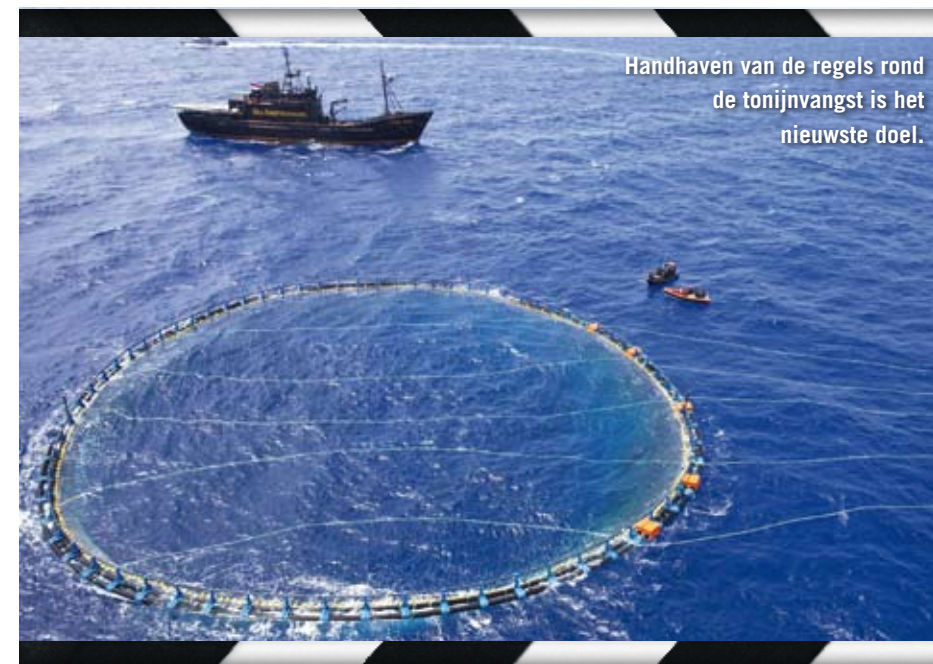
Handhaven van de regels rond de tonijnvangst is het nieuwste doel.

"Het zal in ieder geval moeilijker worden om dit probleem aan te pakken. Of het gevaarlijker is, zien we dan wel weer. De Japanse walvisvaardervloot is niet zo heel erg groot in aantal en daardoor vrij goed te overzien. In tegenstelling tot de jacht op blauwvintonijn: er zijn vele schepen en een grote technologische industrie die probeert zoveel mogelijk blauwvintonijn te vangen. Binnen tien dagen nadat de campagne startte, werd de Steve Irwin geramd door een Italiaans schip dat onder de Lybische vlag voer. De gestelde quota zullen worden omzeild doordat er een Japans overslagschip in de zee ligt dat de vangst direct naar Japan zal doorsluizen zonder dat de vangst ooit aan