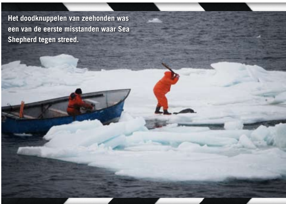
Het doodknuppelen van zeehonden was een van de eerste misstanden waar Sea Shepherd tegen streed.

“Ik kan zelf wel duiken, maar heb er de afgelopen jaren geen tijd meer voor gehad. Hooguit om eens wat werkzaamheden aan mijn boot te verrichten. Mijn persoonlijke mening – dus geen Sea Shepherd-standpunt – is dat duiken het zeeleven in zijn algemeenheid geen goed zal doen, maar aan de andere kant creëert het wel een bewustzijn bij mensen, omdat mensen dan met eigen ogen kunnen zien hoe de zeeën achteruitgaan.” □