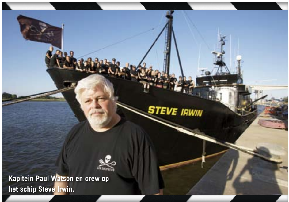
Kapitein Paul Watson en crew op het schip Steve Irwin.

Begin 2009 liepen de gemoederen op de Antarctische Oceaan hoog op en het schip Steve Irwin kwam in aanvaring met de Japanse walvisvaarder Yushin Maru 2. Daarop dienden de Japanners een aanklacht in bij de vlagstaat Nederland. Minister-President Jan-Peter Balkenende sprak er schande van en beloofde de registratie ongedaan te maken. Het is echter nooit zover gekomen. Sterker nog, sinds kort vaart ook het schip Bob Barker onder de Nederlandse vlag.